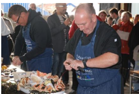
Concours des meilleurs écaillers 2015

Les deux premier lauréats du concours d'écaillers Charente Maritime seront qualifiés pour le Championnat de France