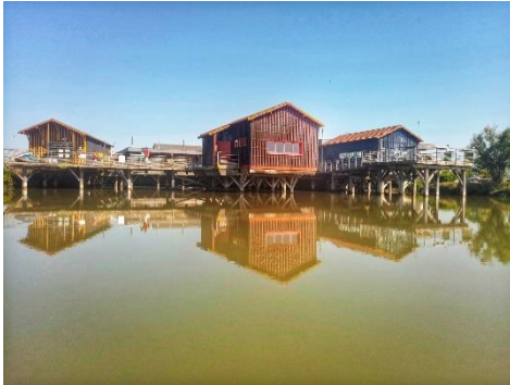
La Cité de l'Huître

Au programme de la visite : La Cité de l'Huître et la ferme ostréicole de la Cabane des Claires pour tout connaître sur l'huître : son histoire, sa culture, sa gastronomie ... Des animations originales sur le thème des marées, du métier d'ostréiculteur, du marais avec des initiations à l'ouverture des huîtres