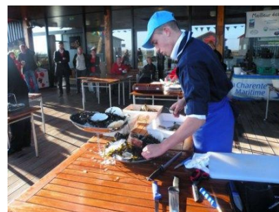
Concours étudiant de la « Bourriche d'or Marennes Oléron »