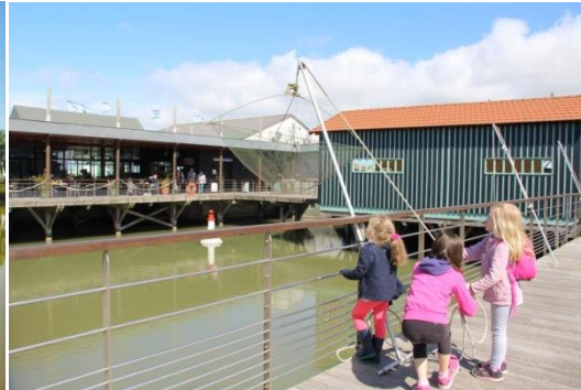
Pêche au carrelet sur le ponton