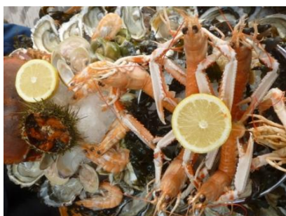
Plateau de fruits de mer