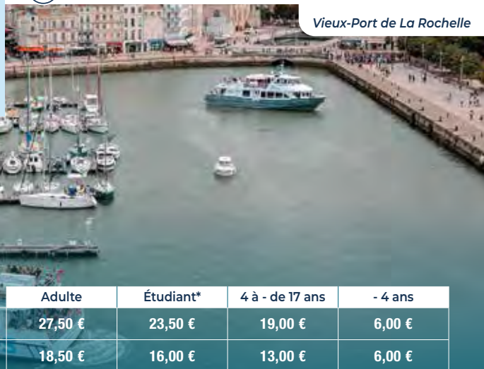
Vieux-Port de La Rochelle

Office de tourisme : 05 46 41 14 68 - larochelle-tourisme.com